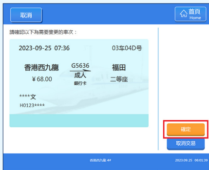
再次核對要變更車次的車票資料後，按【確定】