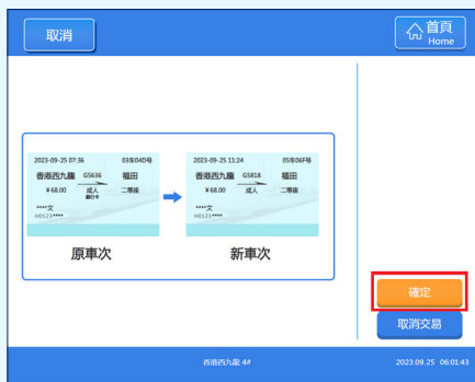
5 之後會顯示新舊車票的資料，核對清楚資料後按【確定】