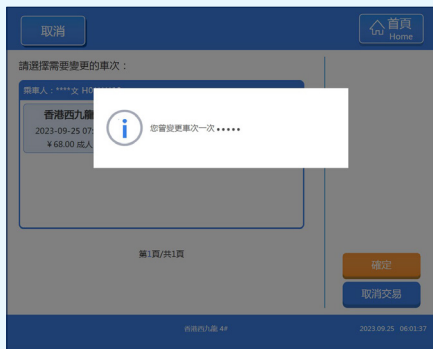
之後螢幕會顯示可辦理「靈活行」的剩餘次數