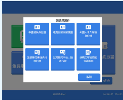
2 選擇要辦理「靈活行」手續的旅客證件，然後掃描證件