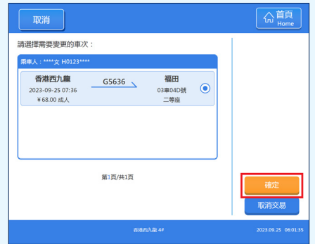
3 選擇要變更車次的車票，然後按【確定】