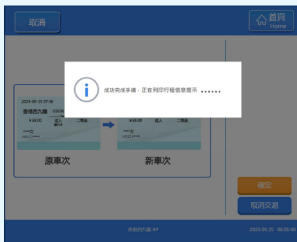
6 完成手續後，系統會自動列印「行程信息提示」，會顯示車票的資料，方便乘車