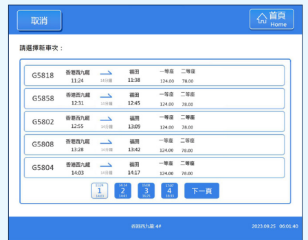
4 選擇新車次（螢幕會顯示符合這個乘車安排的車次）